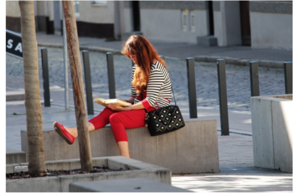
Obr. 3: Vhodně a nevhodně vybraný ilustrační obrázek