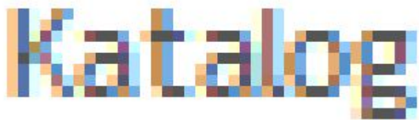
Obr. 1: Rozostření textu ve formě obrázku při zvětšení stránky

Na obr. 1 vidíte ukázkou rozostření obrázkového textu, ke kterému dojde při zvětšení obrázku/stránky.