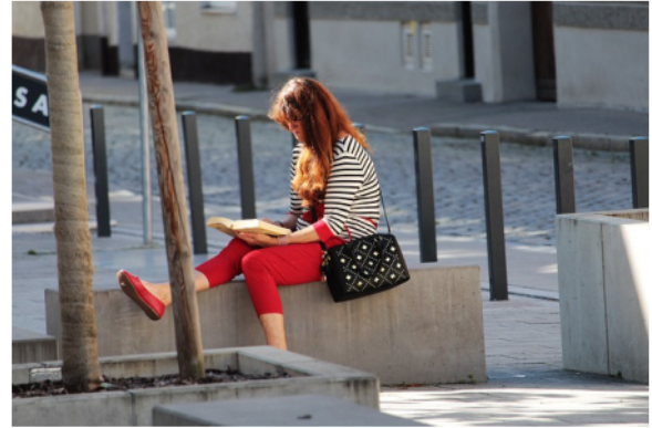
Obr. 3: Vhodně a nevhodně vybraný ilustrační obrázek