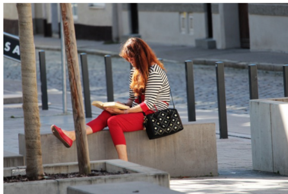
Obr. 3: Vhodně a nevhodně vybraný ilustrační obrázek