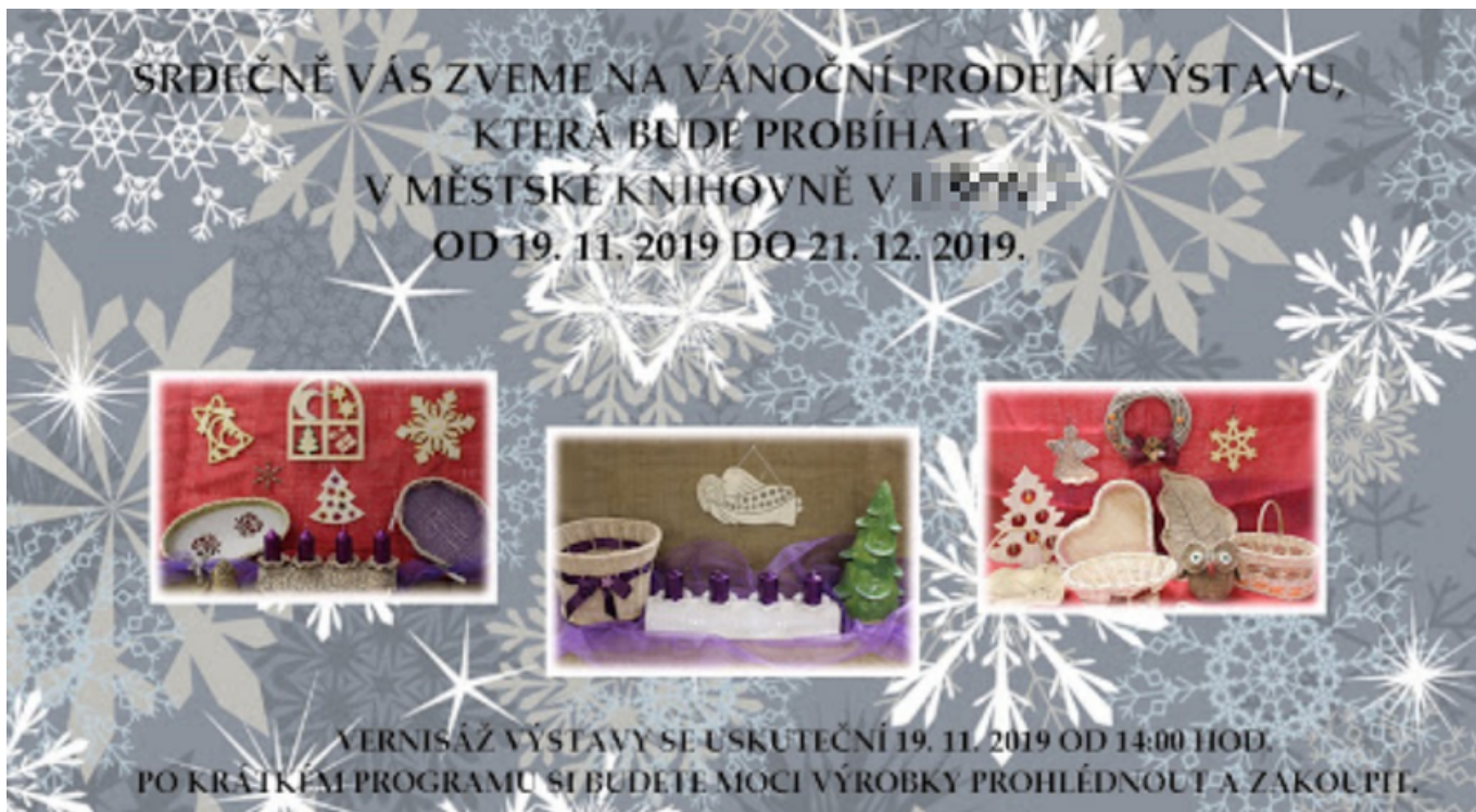
Obr. 6: Příklad nevhodně zvoleného podkladu textu

Na obr. 7 je ukázka sloganu knihovny umístěného na obrázku. Vzhledem k tomu, že jde o větší písmo a krátký text, nejde o kritický problém, ale část textu „Knihovna, kde to žije“ není příliš výrazná, což kupříkladu uživatelům se zrakovým postižením může ztížit vnímání informací.