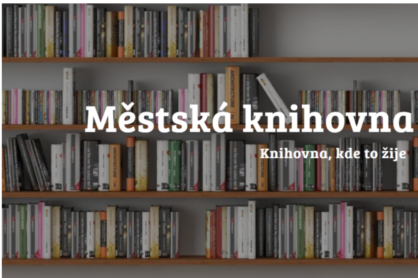
Obr. 7: Příklad mírně problematického textu umístěného na obrázkový podklad

Na obr. 7 je ukázka sloganu knihovny umístěného na obrázku. Vzhledem k tomu, že jde o větší písmo a krátký text, nejde o kritický problém, ale část textu „Knihovna, kde to žije“ není příliš výrazná, což kupříkladu uživatelům se zrakovým postižením může ztížit vnímání informací.