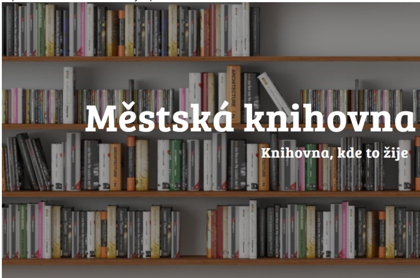
Obr. 5: Příklad mírně problematického textu umístěného na obrázkový podklad

Na obr. 5 je ukázka sloganu knihovny umístěného na obrázku. Vzhledem k tomu, že jde o větší písmo a krátký text, nejde o kritický problém, ale část textu „knihovna, kde to žije“ není příliš výrazná, což kupříkladu uživatelům se zrakovým postižením může ztížit vnímání informací.