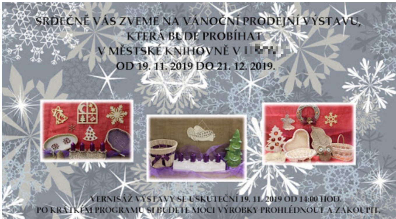
Obr. 4: Příklad nevhodně zvoleného podkladu textu

Na obr. 5 je ukázka sloganu knihovny umístěného na obrázku. Vzhledem k tomu, že jde o větší písmo a krátký text, nejde o kritický problém, ale část textu „knihovna, kde to žije“ není příliš výrazná, což kupříkladu uživatelům se zrakovým postižením může ztížit vnímání informací.