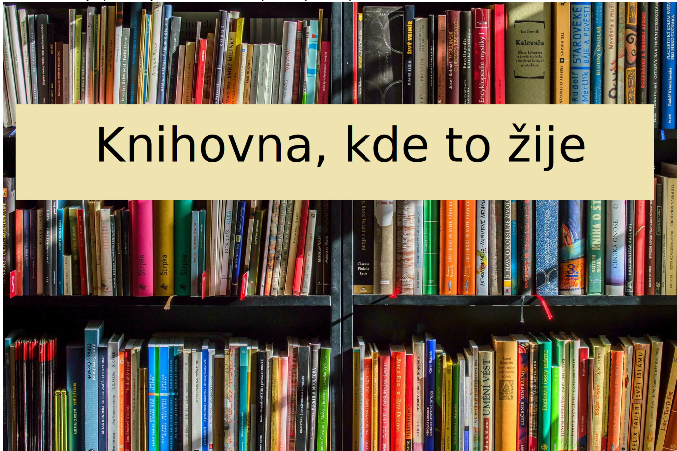
Obr. 6: Příklad využití barevného pruhu jako podkladu pro text v obrázku