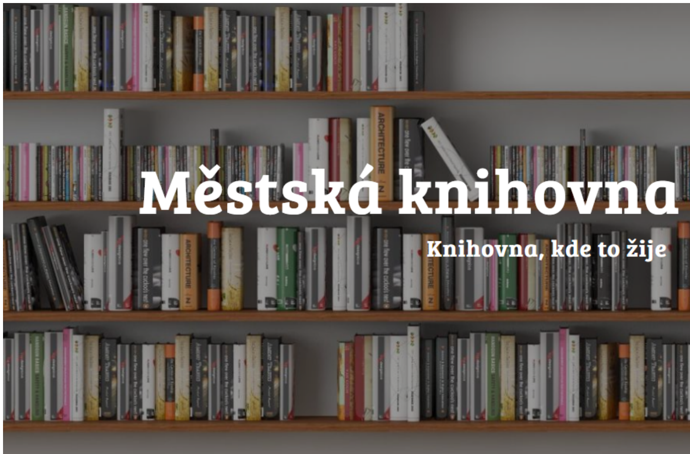
Obr. 5: Příklad mírně problematického textu umístěného na obrázkový podklad