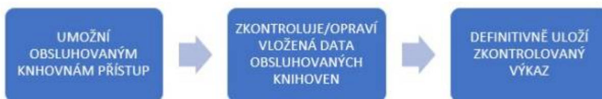
Obr. 6 - Postup práce s daty - pověřená knihovna