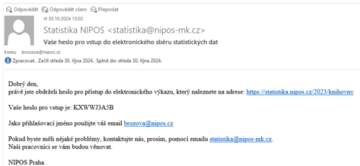
Obr. 14 - Ukázka úvodní zprávy pro nového uživatele databáze elektronického sběru

Pro obsluhované knihovny je přímé vkládání dat (s platností od ledna 2025) zcela novou možností, jak odevzdávat statistická data.