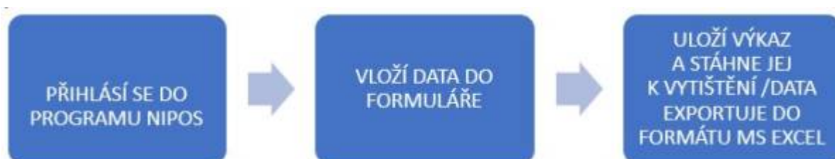
Obr. 7 - Postup práce s daty - obsluhovaná knihovna

Krajská knihovna bude mít možnost exportovat data do MS Excel za celý kraj. V rámci staženého souboru bude možné filtrovat data podle pověřených knihoven i podle typu knihovny. To znamená, že bude mít k dispozici na jednom místě všechna data za celý kraj a připravená pro další práci.