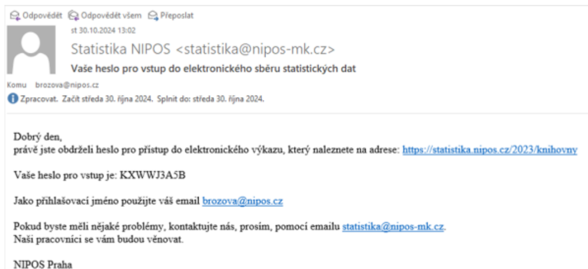
Obr. 14 - Ukázka úvodní zprávy pro nového uživatele databáze elektronického sběru

Pro obsluhované knihovny je přímé vkládání dat (s platností od ledna 2025) zcela novou možností, jak odevzdávat statistická data.