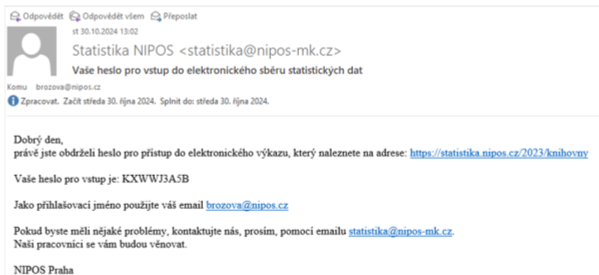
Obr. 14 – Ukázka úvodní zprávy pro nového uživatele databáze elektronického sběru

Pro obsluhované knihovny je přímé vkládání dat (s platností od ledna 2025) zcela novou možností, jak odevzdávat statistická data.