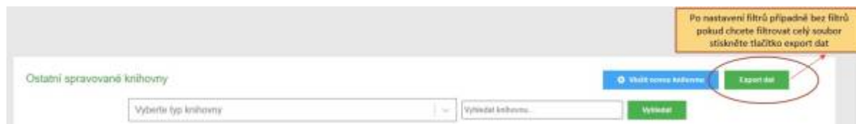
Obr. 12a) – Ukázka exportu dat z pohledu pověřené knihovny

kterým převede všechna data z elektronických výkazů svých obsluhovaných knihoven do formátu MS Excel pro další práce. Může ale také filtrovat knihovny podle typu a vybranou skupinu pak následně exportovat. Export dat je velmi dobrý a rychlý nástroj pro kontrolu a vyhodnocování celkových i dílčích dat.