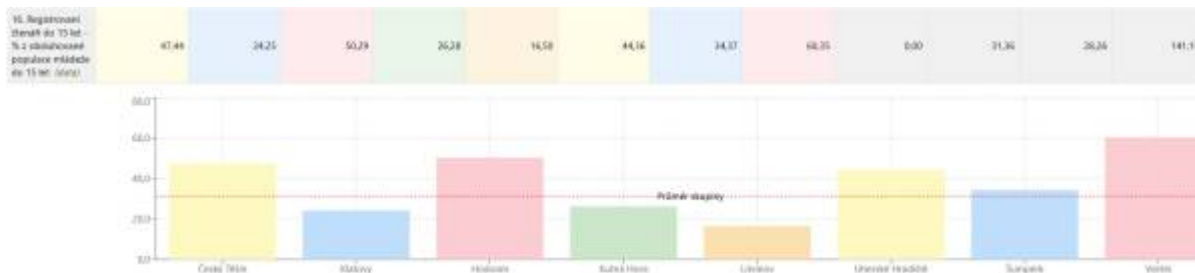
Obr. 21 – Procento registrovaných čtenářů v kategorii do 15 let z obsluhované populace mládeže do 15 let