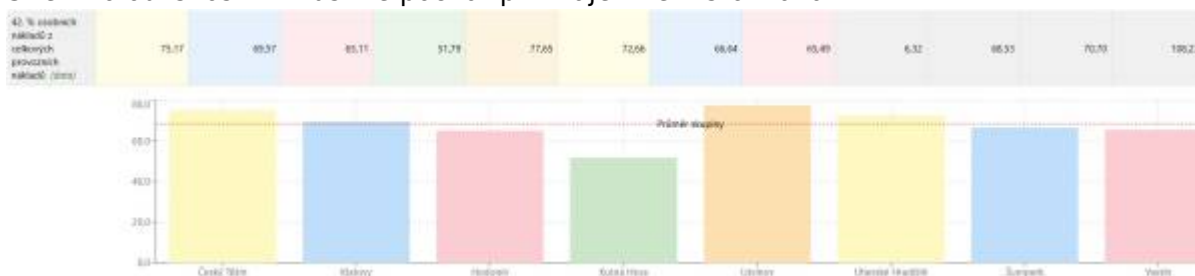
Obr. 20 – Procento personálních nákladů z celkových provozních výdajů knihovny

S těmito odlišnostmi musíme počítat při vzájemném srovnávání.