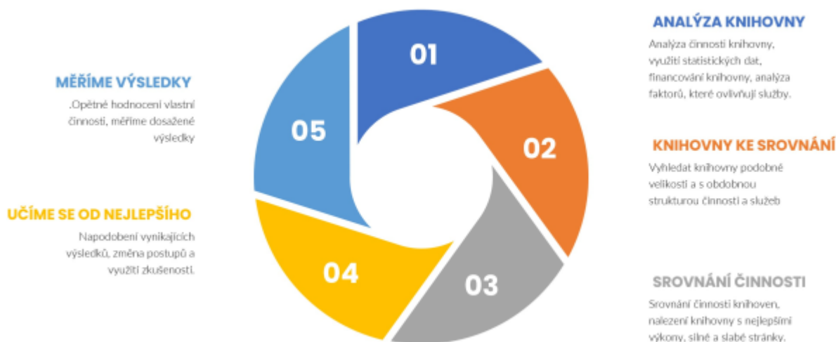
Obr. 19 – Průběžné hodnocení činnosti knihovny