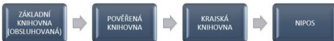
Obr. 19: Proces sběru statistických dat

Povinnost vyplnit a odevzdat statistiku úplně, přesně a včas má ze zákona každá zpravodajská jednotka (knihovna).