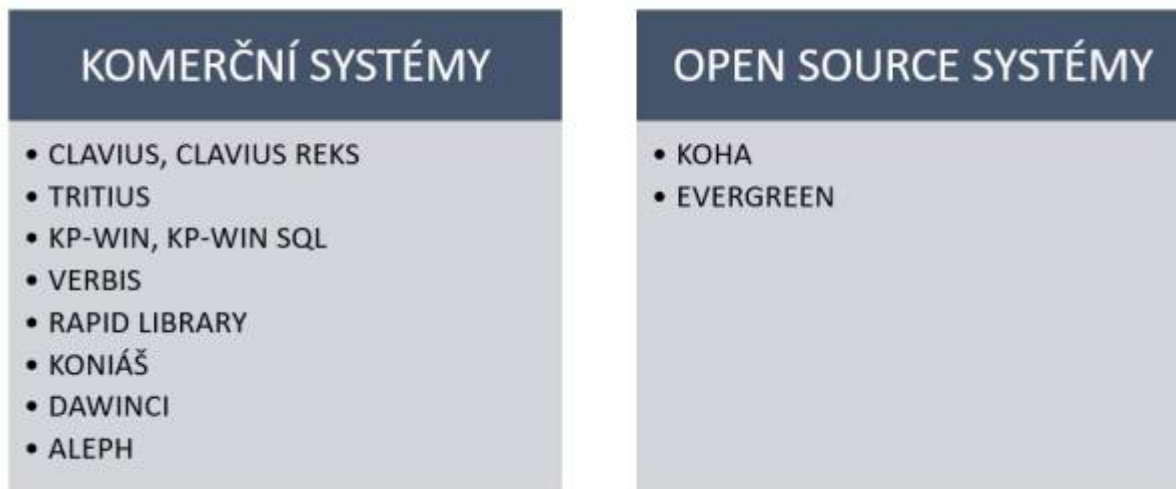
Obr. 14: Komerční a nekomerční AKS

Systémový knihovník je pozice, která se uplatňuje v knihovnách s komerčním i nekomerčním systémem.