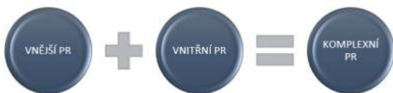
Obr. 18: Směry komunikace PR