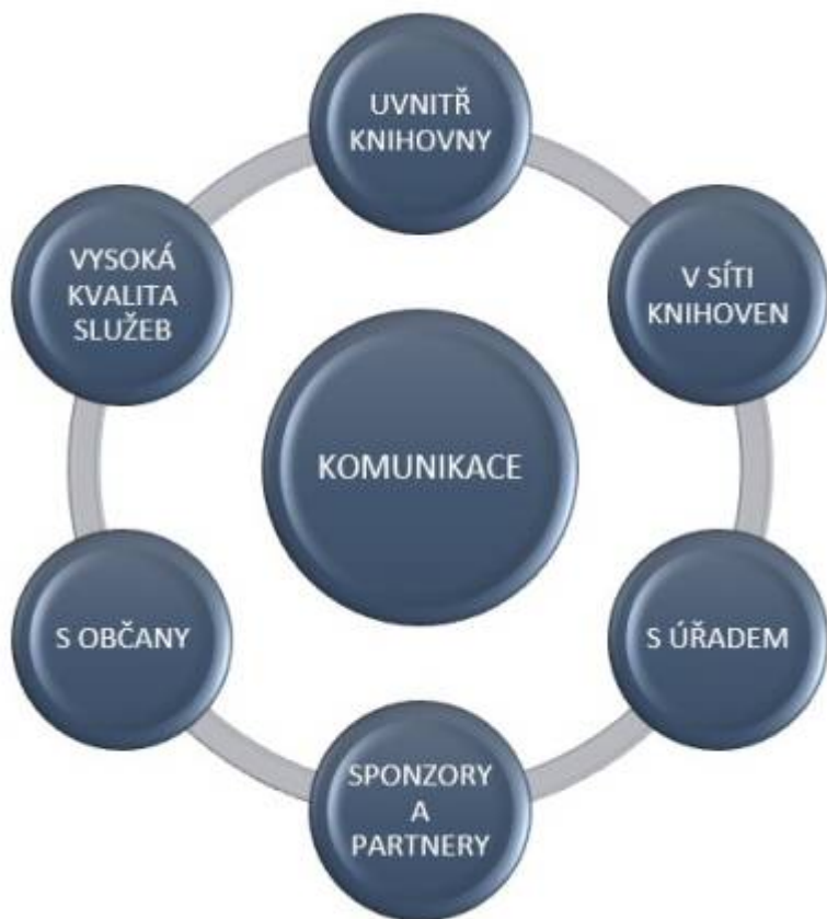
Obr. 17: PR komunikace v knihovnách

PR představují důležité činnosti, kterými se knihovna musí denně zabývat. PR je cestou k uživatelům, zřizovateli/provozovateli knihovny nebo sponzorovi, kteří knihovny do jisté míry „živí“. Proto bude dobré, když se o knihovnách bude pozitivně mluvit, když budou lidé vědět, že „jejich knihovna“ dělá svou práci dobře. Každodenní součástí práce je informovanost okolí o práci, aktivitách a novinkách v knihovně. Jde také o správnou komunikaci uvnitř instituce, mezi pracovníky knihovny, o stálé zlepšování pracovní a důvěryhodné atmosféry, která se jistě projeví i navenek.