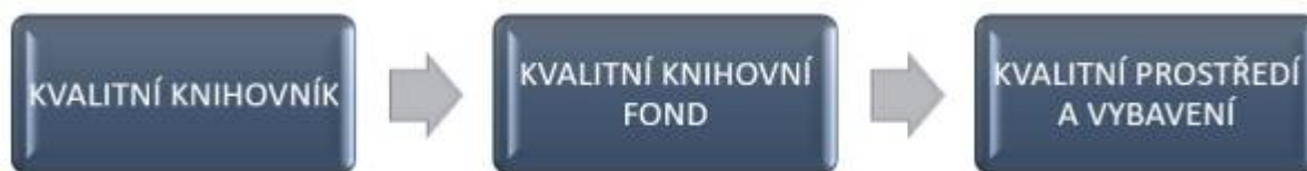
Obr. 13: Podmínky pro kvalitní vzdělávací akce

Stále větší počet knihoven v ČR pořádá různé kulturní a vzdělávací akce (např. veřejná čtení v knihovně, křty knih, besedy a přednášky, tvůrčí dílny, výukové lekce pro školy, celoživotní vzdělávání pro seniory a mnohé další). Komunitní knihovna napomáhá rozvoji společnosti v místě svého působení – podporuje dobré soužití lidí v místě, pomáhá zlepšovat místo/obec/město, ve kterém žijí, a rozvíjet dobré občanské vztahy mezi lidmi, skupinami lidí i organizacemi na daném území. Aby byla role knihovny při výchově a vzdělávání kvalitní, jsou důležité tři podmínky: