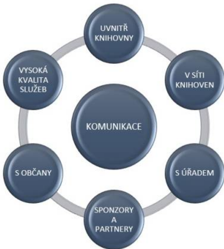
Obr. 17: PR komunikace v knihovnách

PR představují důležité činnosti, kterými se knihovna musí denně zabývat. PR je cestou k uživatelům, zřizovateli/provozovateli knihovny nebo sponzorovi, kteří knihovny do jisté míry „živí“. Proto bude dobré, když se o knihovnách bude pozitivně mluvit, když budou lidé vědět, že „jejich knihovna“ dělá svou práci dobře. Každodenní součástí práce je informovanost okolí o práci, aktivitách a novinkách v knihovně. Jde také o správnou komunikaci uvnitř instituce, mezi pracovníky knihovny, o stálé zlepšování pracovní a důvěryhodné atmosféry, která se jistě projeví i navenek.