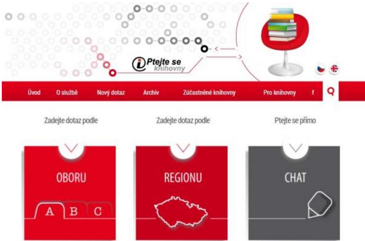
Obr. 26: Web služby Ptejte se knihovny