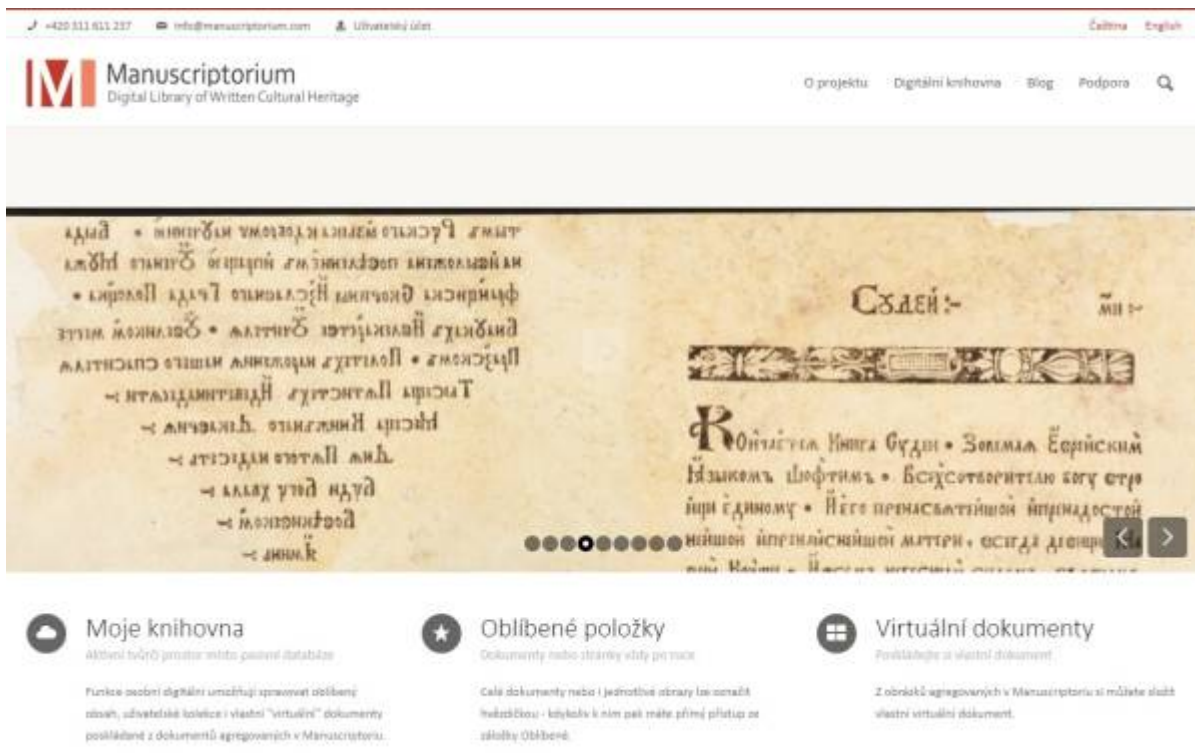
Obr. 25: Web digitální knihovny Manuscriptorium