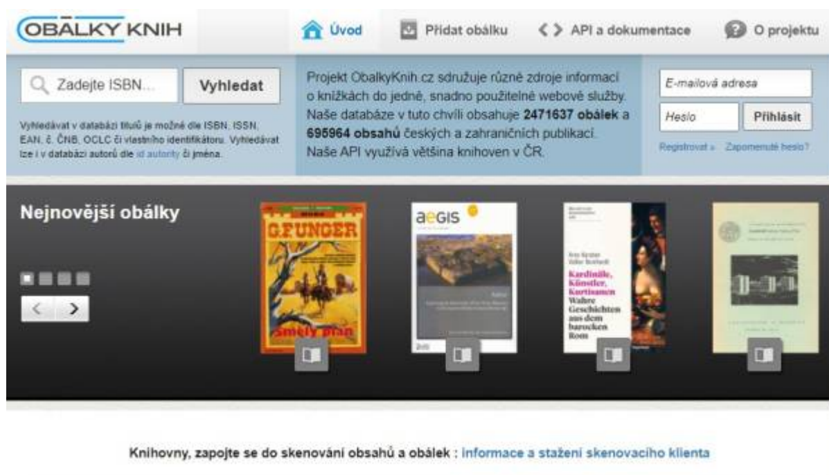
Obr. 24: Web projektu Obálky knih

Systém Obálky knih provozuje a rozvíjí Jihočeská vědecká knihovna v Českých Budějovicích .