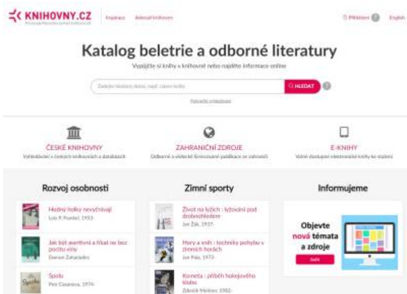
Obr. 22: Vstupní stránka projektu Knihovny.cz

Portál Knihovny.cz poskytuje jednotný přístup ke službám knihoven v ČR komukoliv, odkudkoliv a kdykoliv. Umožňuje prohledávat katalogy a další informační zdroje všech zapojených knihoven z jediného vyhledávacího řádku, rezervaci půjčených knih a objednávky, meziknihovní výpůjční službu i dodávání dokumentů.