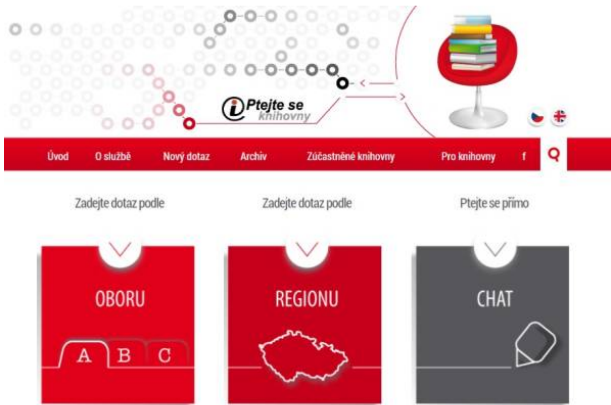
Obr. 26: Webová stránka Ptejte se knihovny