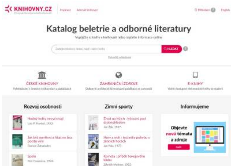
Obr. 22: Vstupní stránka projektu Knihovny.cz

Portál Knihovny.cz poskytuje jednotný přístup ke službám knihoven v ČR komukoliv, odkudkoliv a kdykoliv. Umožňuje prohledávat katalogy a další informační zdroje všech zapojených knihoven z jediného vyhledávacího řádku, rezervaci půjčených knih a objednávky, meziknihovní výpůjční službu i dodávání dokumentů.