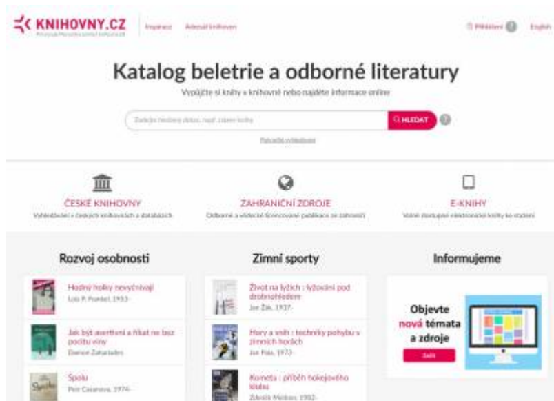
Obr. 22: Vstupní stránka projektu Knihovny.cz

Portál Knihovny.cz poskytuje jednotný přístup ke službám knihoven v ČR komukoliv, odkudkoliv a kdykoliv. Umožňuje prohledávat katalogy a další informační zdroje všech zapojených knihoven z jediného vyhledávacího řádku, rezervaci půjčených knih a objednávky, meziknihovní výpůjční službu i dodávání dokumentů.