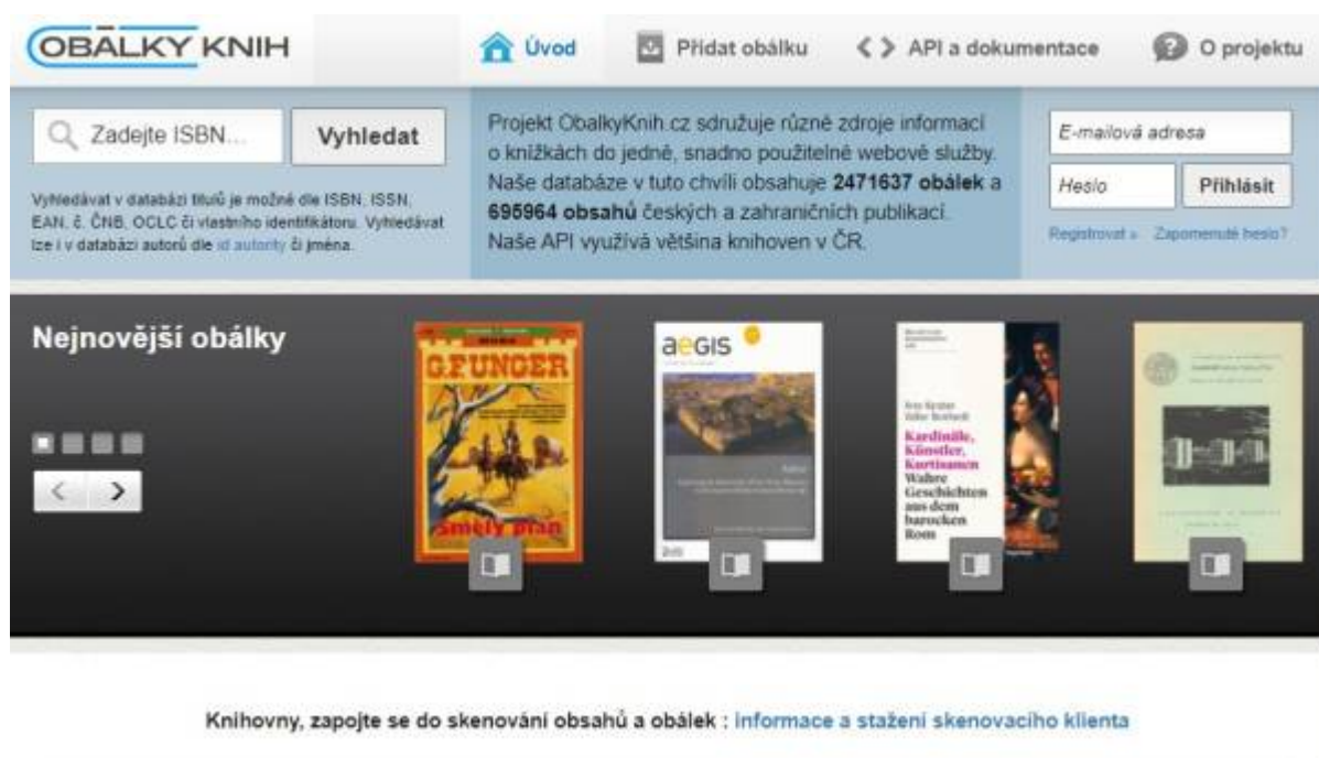
Obr. 24: Web projektu Obálky knih

Systém Obálky knih provozuje a rozvíjí Jihočeská vědecká knihovna v Českých Budějovicích .