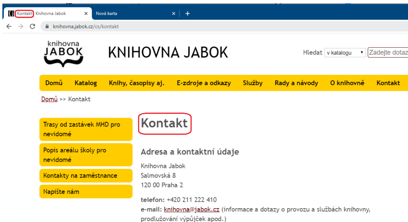
Obr. 1: Zobrazení názvu stránky v nadpisu stránky a v názvu karty prohlížeče