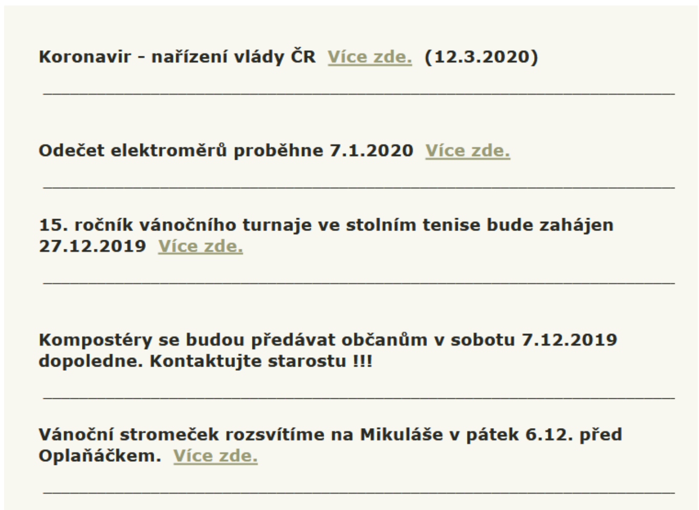
Obr. 2: Nesprávné použití zástupného textu Více zde ; bez okolního kontextu uživatel nezjistí, čeho se odkaz týká (zdroj: obec Oplany , získáno 2020-05-15)

Velice často se zástupné texty typu zde , Více zde , Pro více informací klikněte zde apod. objevují na webových stránkách v sekci aktuality (viz příklady na obr. 2 a 3).