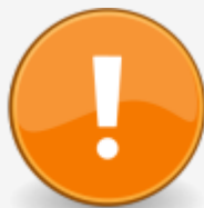
Obr. 4: Vykřičník

Jako příklad si ukažme obrázek vykřičníku (viz obr. 4), sloužící k označení důležitých informací. Obrázek má název „vykr2.png“.