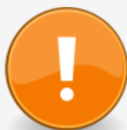
Obr. 4: Vykřičník

Jako příklad si ukažme obrázek vykřičníku (viz obr. 4), sloužící k označení důležitých informací. Obrázek má název „vykr2.png“.