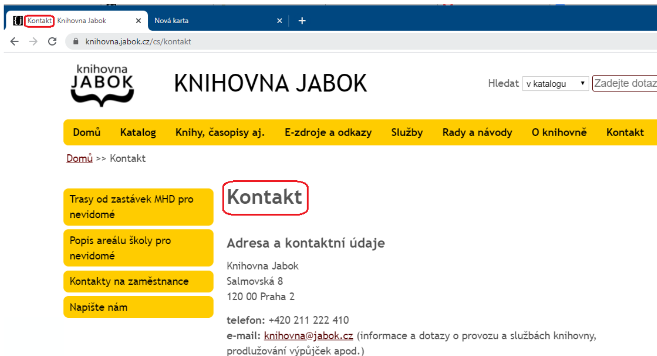
Obr. 1: Zobrazení názvu stránky v nadpisu stránky a v názvu karty prohlížeče

Na každé webové stránce je nutné uvést název stránky . Název stránky je pak většinou zobrazen ve webovém prohlížeči jako název panelu nebo okna; obvykle se také použije jako nadpis první úrovně, viz obr. 1. V redakčních systémech bývá název stránky vyžadován jako povinné pole při vytváření nebo úpravě stránky, viz obr. 2. Název stránky je na ukázkových obrázcích pro přehlednost zvýrazněn červeným rámečkem.