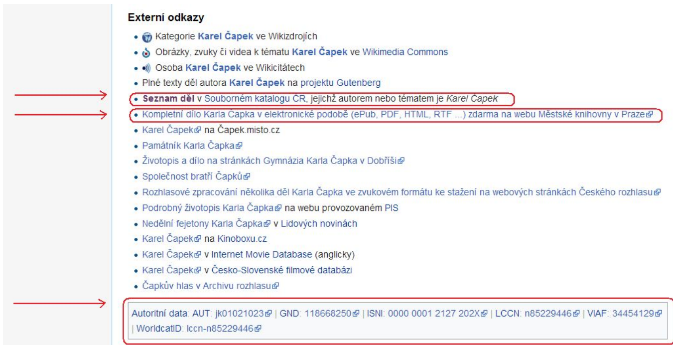
Obr. 3: Ukázka využití autoritního záznamu na Wikipedii k propojení různých webových služeb

Vhodné je, aby se knihovny, které autoritní záznamy využívají, také zapojily do jejich tvorby a přispívaly do databáze autorit. K tomu je potřeba tzv. aktivní klient Z39.50 (s funkcí UPDATE). Je rovněž třeba projít školením zaměřeným na vytváření autoritních záznamů (školení zajišťuje oddělení národních autorit Národní knihovny ČR).